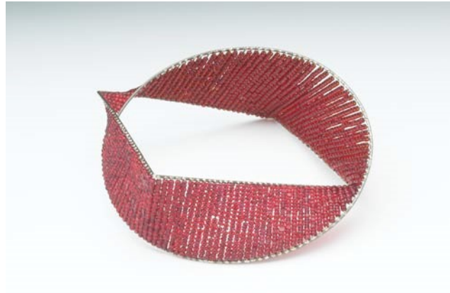
Breichled bangl, 29013, dur gwrthstaen â gleiniau gwydr coch

yn c 25,000 wedi goroesi o Ddwyrain Mesopotamia a'r Hen Aifft. Gall gwydr fod yn dryloyw neu gellir ei wneud yn ddidraidd wrth ychwanegu lliw a gwahanol gynwysyddion. Gall hefyd blygu ac adlewyrchu golau. Mae ei ddefnydd drwy gydol hanes yn cynnwys: llestri, ffenestri, gwydr lliw, lensys, chwyddwydrau etc