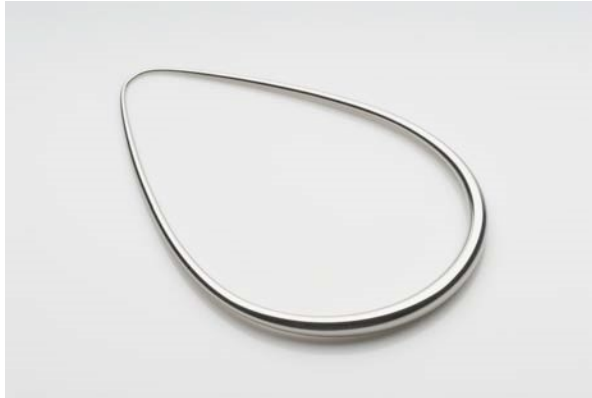
Breichled bangl, 1981, dur gwrthstaen gyredig â llaw

Arian a phlatinwm yw'r metelau gwyn traddodiadol a ddefnyddir ar gyfer gemwaith, ond o'r bedwaredd ganrif ar bymtheg mae dur wedi dod yn ddewis arall sy'n ffasiynol ac yn rhatach.