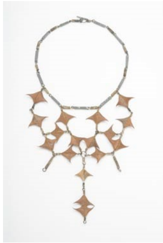
Neclis, 1970, drain, arian a weiren alfanedig

Trafodwch rôl gemwaith fel symbol o statws. Pa eiddo neu nwyddau sydd wedi'u defnyddio fel arwyddion o gyfoeth neu rym mewn cymdeithas?