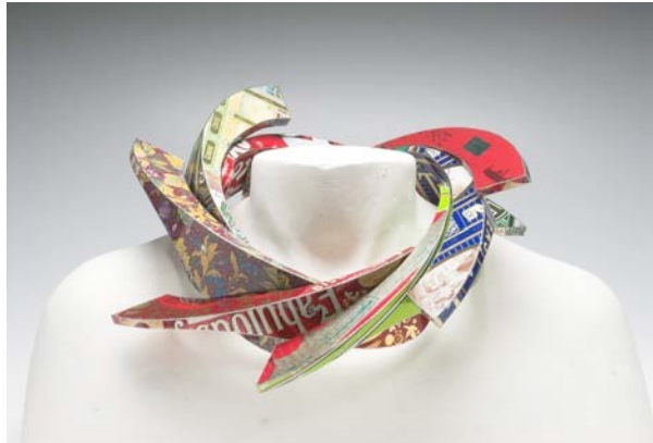
Darn gwddw, 'Popeth y Gallwch ei Fwyta', 2013, dur eildro paentiedig

Trafodwch sut y gallai eitemau gemwaith ymateb i'r gwisgwr. Er enghraifft, gallai metelau claeaf ddod yn gynnes, gallai bangls janglo, metelau adlewyrchu golau neu newid lliw mewn gwahanol amgylcheddau, gallai modrwyau wisgo'n denau neu newid siâp wrth i fysedd dewhau!