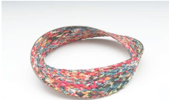
Breichled Bang, 2010, sidan wedi'i wehyddu ar weians dur gwrthstaen wedi'u weldio

Mae Sidan yn ffibr naturiol y gellir ei wehyddu'n decstilau. Fe'i gwnaethpwyd yn gyntaf yn Tsieina hynafol ac, yn hanesyddol, roedd yn eitem foeth yr oedd galw mawr amdani, yn cael ei masnachu rhwng Asia a'r byw Gorllewinol. Ceir y math mwyaf adnabyddus o'r defnydd yma o gocŵn larfa sidanbryf y fwyaren Fair. Daw ei ansawdd clauer, symudliw o strwythur y ffibr sydd fel prism ac sy'n caniatáu i ffabrig sidan blygu golau ar onglau.