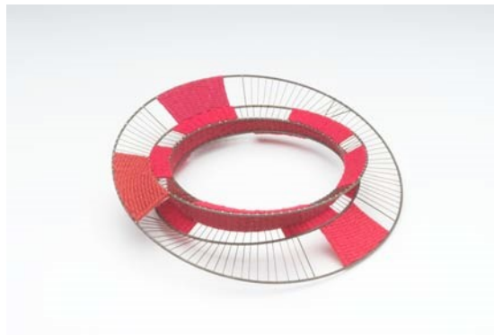
Breichled Bangl, 2010, tapestri wedi'i wehyddu ar wifrau dur gwrthstaen wedi'u weldio

Fe ariennir y prosiect gan Gyngor Celfyddydau Lloegr, wedi'i gomisiynu gan 'The Harley Gallery' a Chanolfan Grefft Rhuthun a'r curadur yw cyn Gyfarwyddwr y Cyngor Crefftau, Dr Louise Taylor.