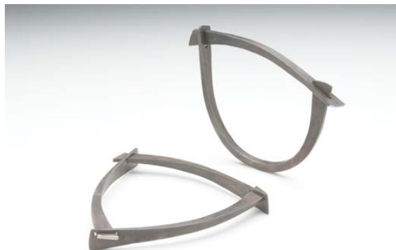
(Fe'i dangosir yn sefyll) Breichled , 2008, titaniwm gofannu poeth mewn dwy ran; fe'i dangosir â (yn gorwedd) Breichled , 2008, titaniwm gofannu poeth mewn tair rhan

Y tro cyntaf i Poston ddefnyddio'r deunydd hwn oedd yn y '60au. Mae Titaniwm yn ddefnydd na ellir ei sodro, ond mae arbrofion diweddar â 'gofannu poeth' wedi caniatáu iddo gynhyrchu ffurfiau coeth, syml: 'Rydw i eto'n mwynhau natur y defnydd yma ac mae ei weldio â laser yn caniatáu i mi wneud modrwyau sy'n ei gyfuno a'i gyferbynnu ag aur.