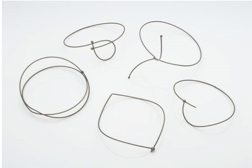
Pum breichled, 1983, cebl dur gwrthstaen sbringog