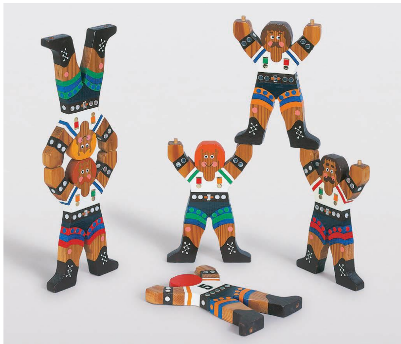
Hole & Peg Acrobats, 1976. Tegan sy'n slotio'n ei gilydd

Mae'r llinellau hyn yn addas i ddisgrifio perfformwyr Peppé, oherwydd tra bod llawer o'r gwaith yn darlunio timau'n gweithio efo'i gilydd, mae yna bwyslais hefyd ar wreiddioldeb ac unigolrwydd. Efallai bod ei acrobataid a'i ddawnswyr wedi eu cerfio o'r un templed, ond mae pob un â'i bersonoliaeth ei hun a gwahaniaethau cynnil yn eu hwynepryd a'u gwisgoedd i nodi eu hunaniaeth unigryw eu hunain.