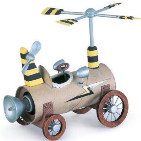
Travelling Toilet Roll , 1991 Model ar gyfer The Mice and the Travel Machine , Viking (1993)

Mae'r pecyn yma wedi ei ddylunio i gynorthwyo athrawon ac addysgwyr gyda chynllunio ymweliad â'r arddangosfa gyda syniadau a awgrymir, gweithdai a phwyntiau trafod. Mae'n canolbwyntio ar adrodd straeon fel dull o ymgysylltu â'r gweithiau a meddwl am y berthynas rhwng gwneud celfyddyd a chreu straeon. Mae'r gweithgareddau'n addas ar gyfer pob oed a gellir eu haddasu i siwtio eich anghenion chi cyn, yn ystod ac ar ôl eich ymweliad.