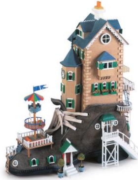
Shoe House, 1980.