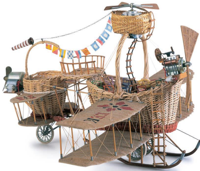
Flying Basket, 1983