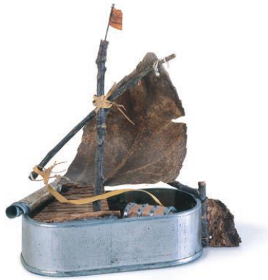
Sardine Tin Boat , 1981 Model ar gyfer The Kattleship Pirates , Viking Kestrel (1983)