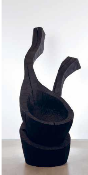
David Nash Two Falling Spoons , 1994 Derw wedi ei gerfio a'i losgi 1900mm