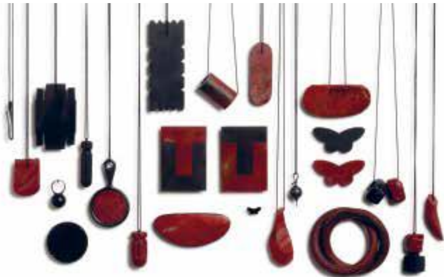
Warwick Freeman A Different Black , 2013 Gwahanol ddefnyddiau

Mae'r pecyn hwn wedi ei ddylunio i gynorthwyo athrawon ac addysgwyr gyda chynllunio ymweliad â'r arddangosfa gyda syniadau a awgrymir, gweithdai a phwyntiau trafod. Mae'n canolbwyntio ar arlunio fel dull o fforio'r gweithiau a meddwl am ymarferiad artistiaid. Mae'r gweithgareddau'n addas i bob oed a gellir eu haddasu ar gyfer eich anghenion chi cyn, yn ystod ac ar ôl eich ymweliad.